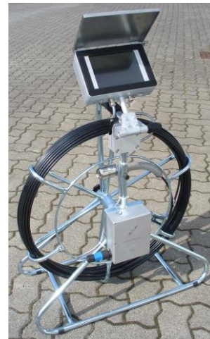
Kamerahaspel 50m mit TFT (IP 65) und automatisch aufrechtem Bild

Typisch: Wir produzieren ein durchdachtes System mit kompatiblen Schnittstellen und austauschbarem Zubehör - und dies seit vielen Jahren.