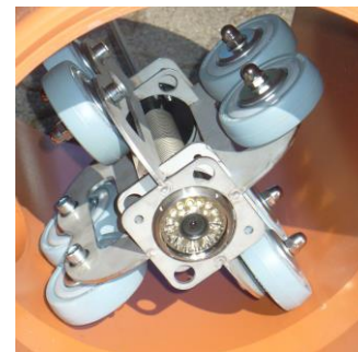
Rollenschiebewagen bis DN 500