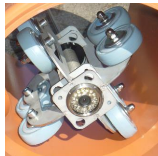
Rollenschiebewagen bis DN 500