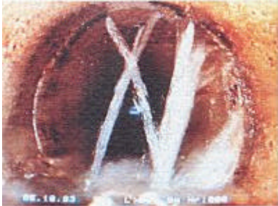
Beschreibung: Rohrleitung Wassereinbruch