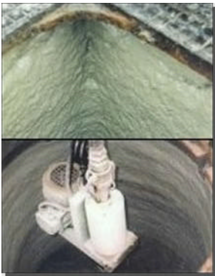
Beschreibung: Auflagefläche Gitterrost Schlammfang korrodiert