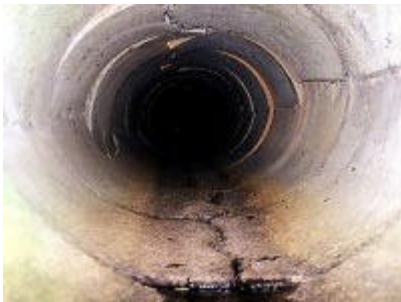
Beschreibung: Rohrleitung Risse