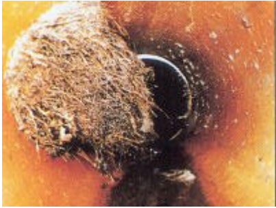
Beschreibung: Rohrleitung Wurzeleinwuchs